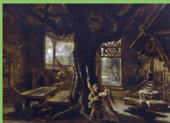
Die Walküre 1. Aufzug 1876 Entwurf Josef Hoffmann