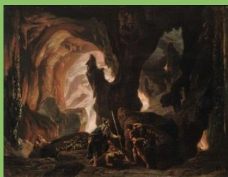
Das Rheingold 3. Bild 1876 Entwurf Josef Hoffmann

18:45-19:45 Gespräch mit Michael v. z. Mühlen (Regisseur, Berlin): Reenactment als Inszenierungspraxis , Moderation: Ulrike Hartung ( fimt , Universität Bayreuth)