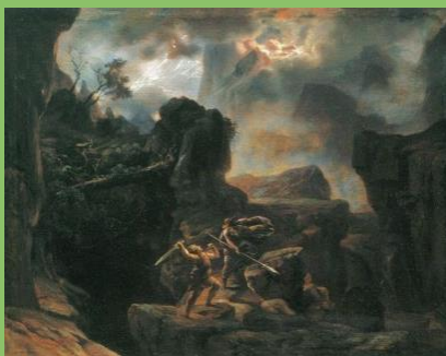
Siegfried 3. Aufzug 1. Bild 1876 Entwurf Josef Hoffmann